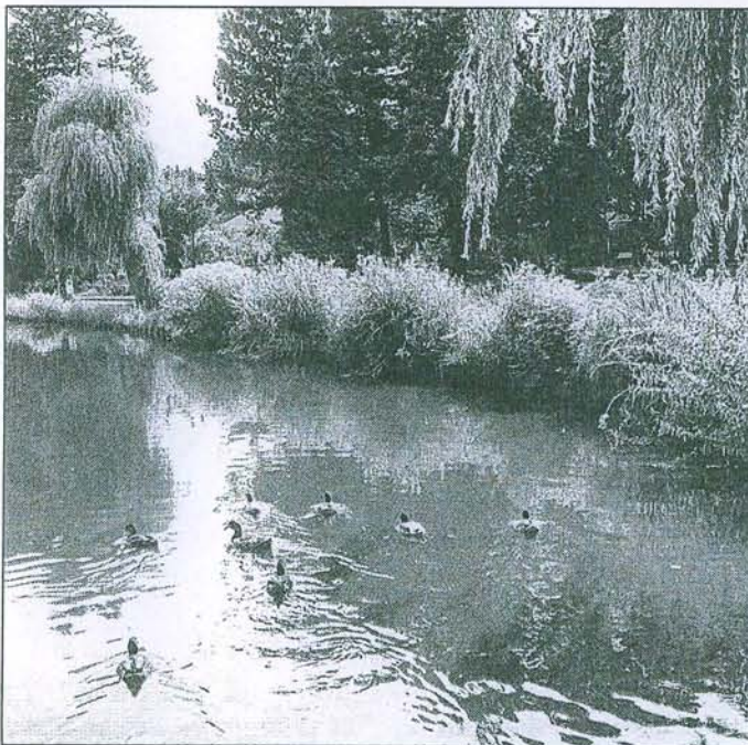
Eines der idyllischsten Plätzchen in Uetersen: das Rosarium. Sein 75-jähriges Bestehen wird in die Feierlichkeiten integriert.

Während der Festwoche gibt es täglich in den Nachmittags- und Abendstunden etwas zu erleben. Ohne Pause schließt sich als weiterer Höhepunkt das Altstadtfest mit Oldtimertreffen und Konzerten an. Besondere Begegnungen entstehen während des klösterlichen Abendspaziergangs: „Bekannte Personen stellen Szenen aus dem damaligen Leben nach“, verrät Stange und lächelt bei der Vorstellung, welche Politiker die Zuschauer unter den Kostümen dann entdecken können.